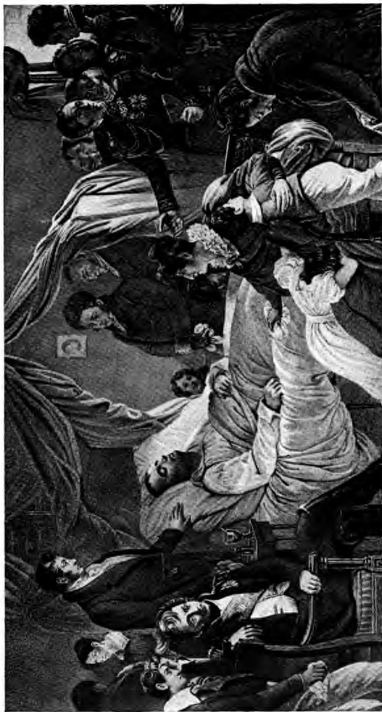
MORT DE NAPOLÉON d'après Steuben.